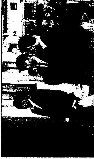
高校生を求人企業に引率