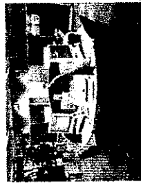
求人検索コーナーでは、インターネットにより全国の学卒求人情報を提供