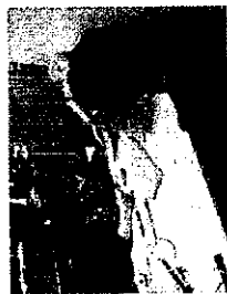
応募先の選定等就職活動の進め方についての相談を実施